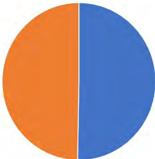
CULTO E PASTORALE